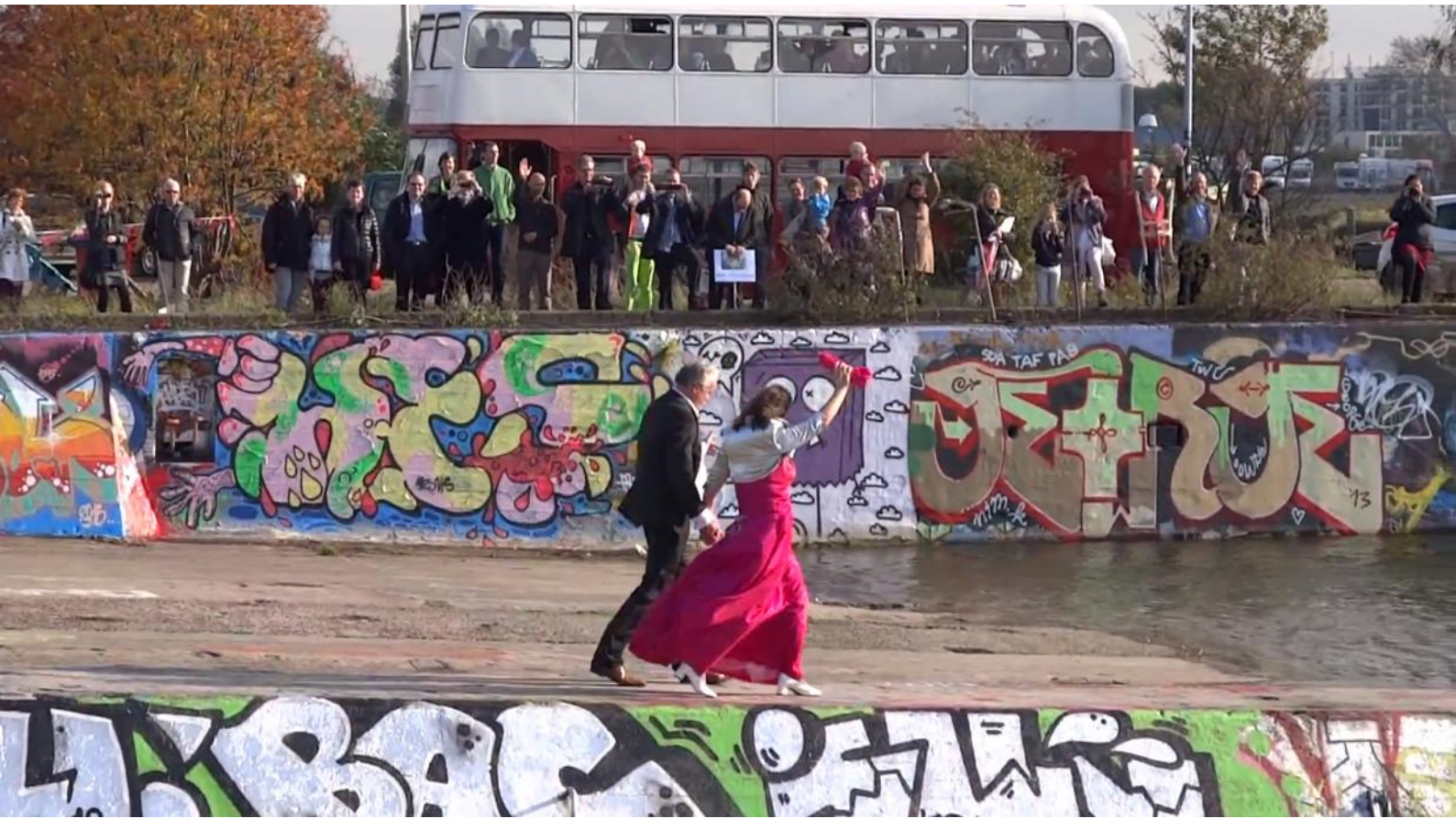
Still uit film

Het was een stunt die het NOS-Journaal haalde: in de nacht van 26 op 27 oktober 2013, toen de klok net een uur was teruggezet, kon je op de NDSM-werf officieus in het huwelijk treden, zodat je om kwart voor drie oude tijd nog ongehuwd was en op diezelfde dag om kwart over twee wel al getrouwd kon zijn. Of omgekeerd.